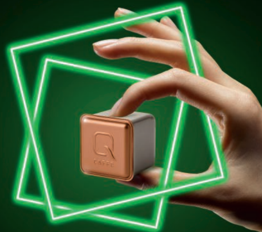
EINE ECKE NACHHALTIGER.