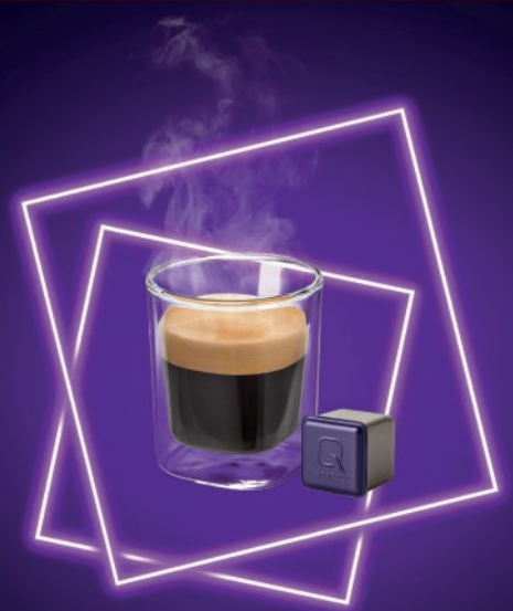
ECKIGE KAPSEL, VOLLES AROMA.