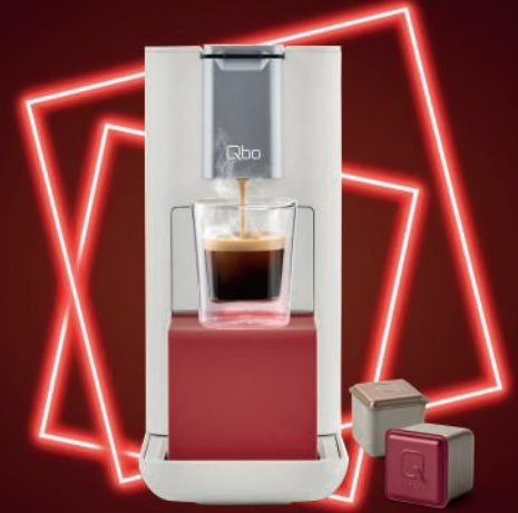
NEUES KAPSELSYSTEM, ECKIGE KAPSEL.